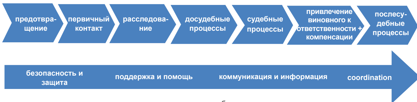
ДИАГРАММА 1: Непрерывный процесс правосудия

совершенное над ними, при решении вопросов опеки над детьми и доступа к детям. 3