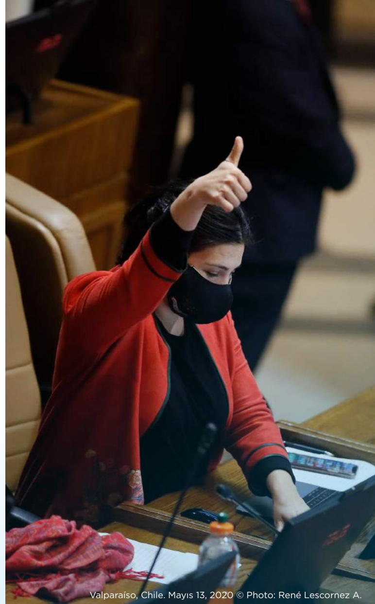
Valparaíso, Chile. Mayıs 13, 2020