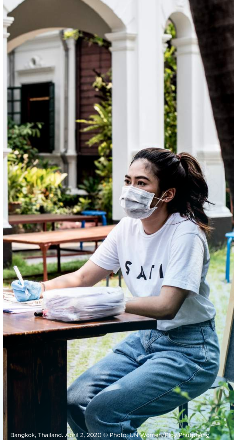
Bangkok, Thailand. April 2, 2020

Meclisler, toplumsal cinsiyete duyarlılığı salgına yönelik hazırlanan müdahale planlarına dahil etmeyi sağlayacak imkânları değerlendirmeli, gerekli olması halinde bu planlarda değişiklik yapmalıdır.