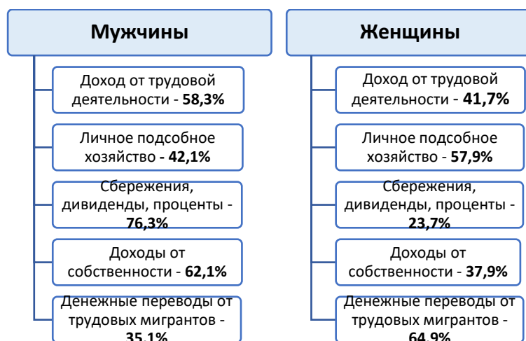
Рисунок 2. Распределение населения трудоспособного возраста РТ в разрезе пола по отдельным источникам средств к существованию (по результатам переписи населения 2010 года) 10

По источникам средств к существованию между женщинами и мужчинами трудоспособного возраста можно увидеть существенные различия и большую социально-экономическую уязвимость женщин. Показатель по такому источнику доходов, как сбережения и дивиденды фиксирует еще большее ограничение возможностей женщин, по сравнению с мужчинами. Доля женщин ограничивается только 23,7%. Среди сельского трудоспособного населения, получающего доход от сбережений и дивидендов, доля женщин около 19%.