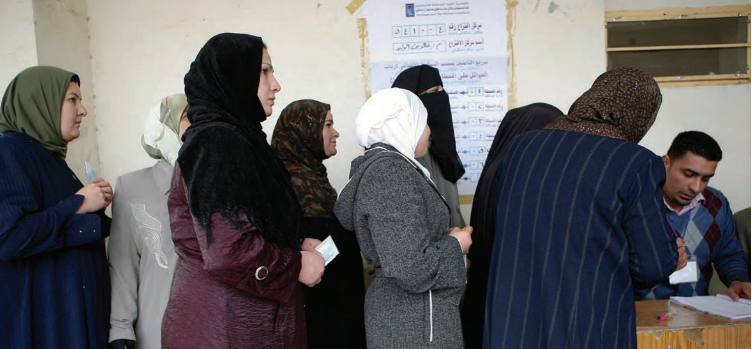
Des électorales irakiennes en file d'attente devant dans un bureau de vote.

le Dialogue international sur la consolidation de la paix et le renforcement de l'État : New Deal pour l'engagement dans les États fragiles 8 identifient cinq priorités stratégiques dans les situations d'après-conflit. Ces domaines prioritaires se recoupent largement. D'autres documents de réflexion ou des notes d'orientation du Recueil d'informations d'ONU Femmes