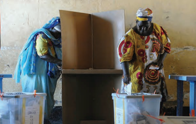
Des femmes de Juba, au Soudan, votent aux élections présidentielles de leur pays, les premières à être organisées depuis près de 25 ans. Initialement fixé du 11 au 13 avril, le vote a été prolongé de deux jours.

La raison n'en était pas seulement d'éviter les intimidations, mais aussi de contrer les pressions exercées pour suivre les habitudes de vote de la famille. S'assurer que les observateurs électoraux nationaux, régionaux et internationaux comprennent que le vote familial est illégal, et qu'ils peuvent l'identifier et le documenter devrait être un volet essentiel de la formation des observateurs électoraux. Ces derniers devraient par ailleurs avoir des listes permettant de comprendre les disparités de genre pouvant apparaître au cours d'une élection. L'OSCE a rédigé un manuel détaillé sur la surveillance de la participation des femmes aux élections, comportant une liste de contrôle à l'intention des observateurs électoraux 15 . Cette liste peut être facilement adaptée à différents contextes.