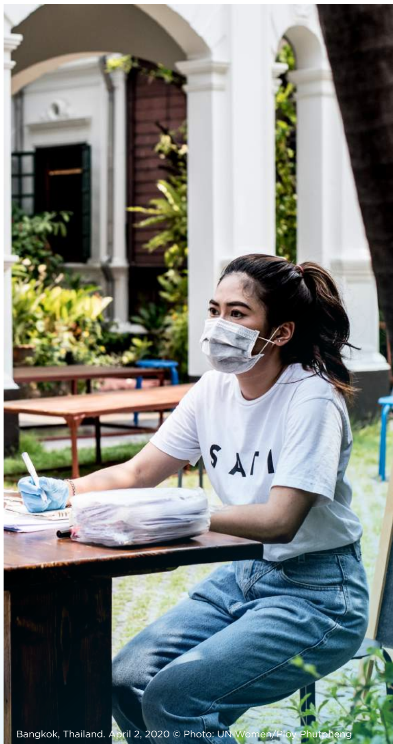
Bangkok, Thailand. April 2, 2020