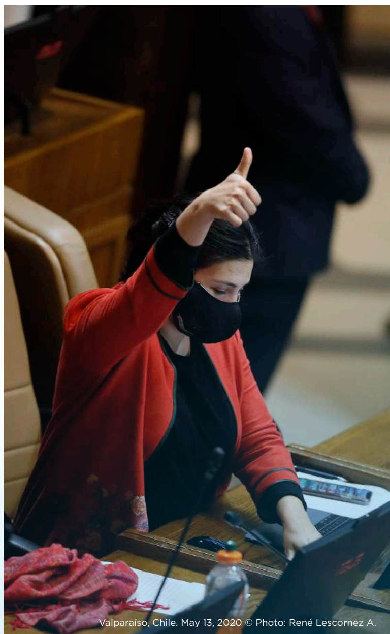
Valparaíso, Chile. May 13, 2020