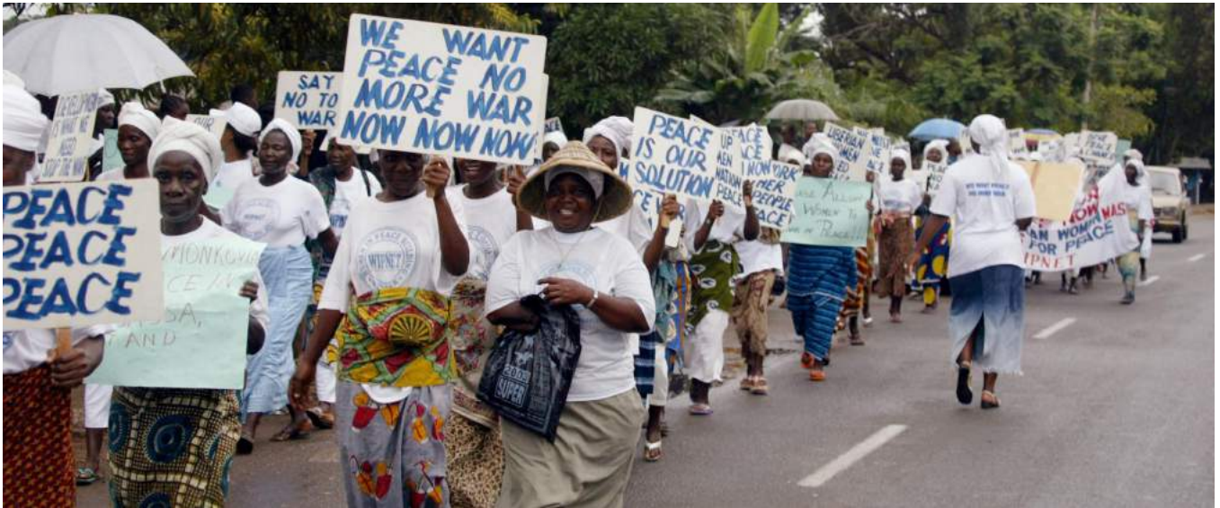
Des femmes du Réseau de consolidation de la paix (WIPNET) organisent une marche de protestation devant le siège de l'ECOMIL (force de maintien de la paix envoyée par la Communauté économique des États de l'Afrique de l'Ouest à Monrovia, au Libéria.